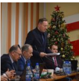
XVII Sesja Rady Powiatu Sierpeckiego