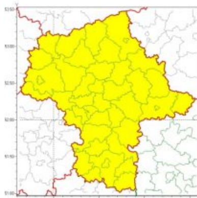
Silny wiatr 2022-01-19 14:14