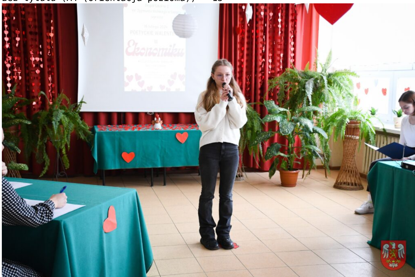
Bez tytułu (A4 (orientacja pozioma)) – 16