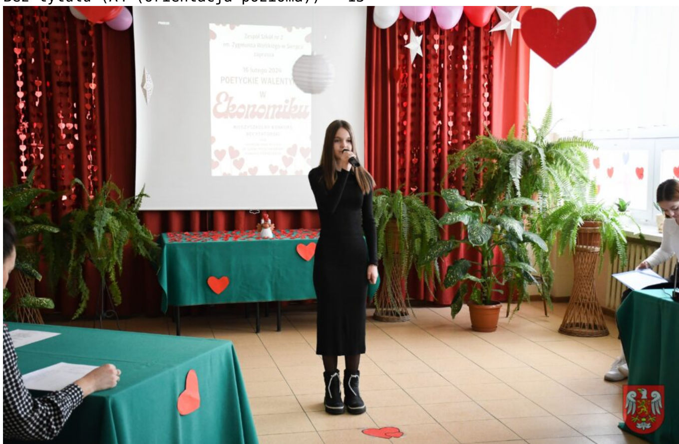
Bez tytułu (A4 (orientacja pozioma)) – 14