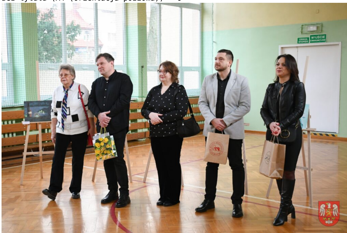
Bez tytułu (A4 (orientacja pozioma)) – 10