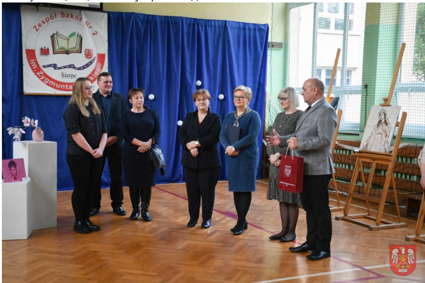
Bez tytułu (A4 (orientacja pozioma)) – 8