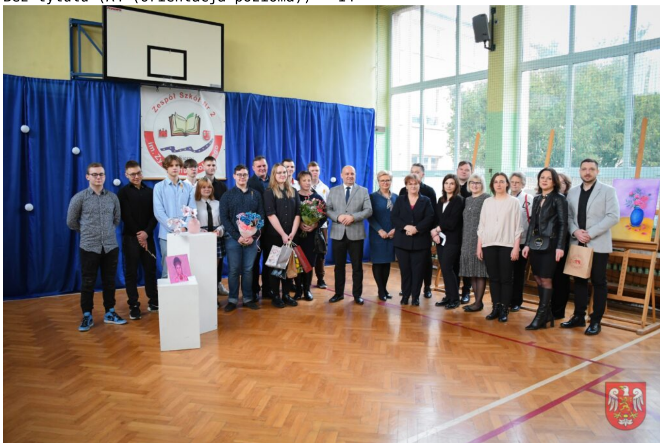
Bez tytułu (A4 (orientacja pozioma)) – 15