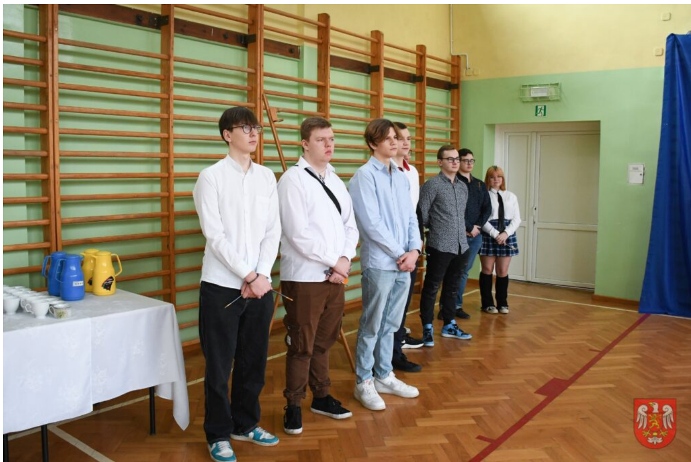
Bez tytułu (A4 (orientacja pozioma)) – 9