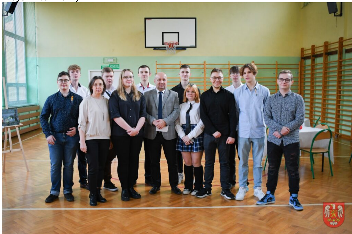
Bez tytułu (A4 (orientacja pozioma)) – 20