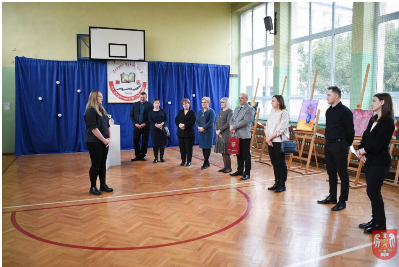
Bez tytułu (A4 (orientacja pozioma)) – 7