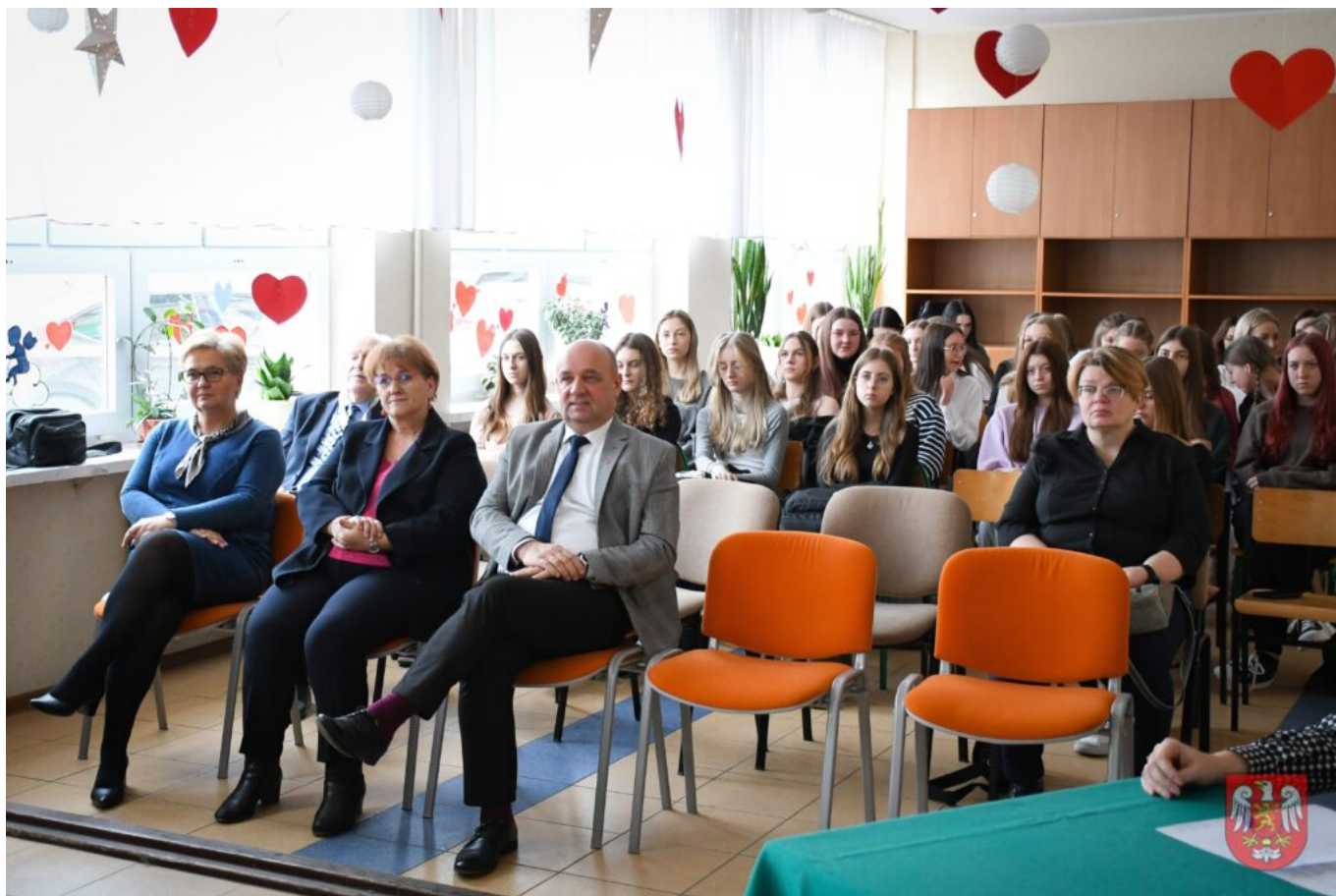
Bez tytułu (A4 (orientacja pozioma)) – 19