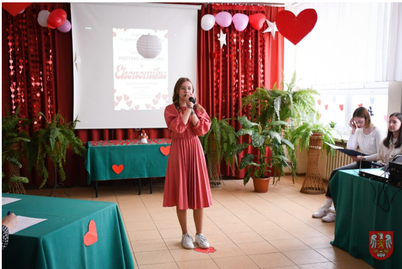
Bez tytułu (A4 (orientacja pozioma)) – 9