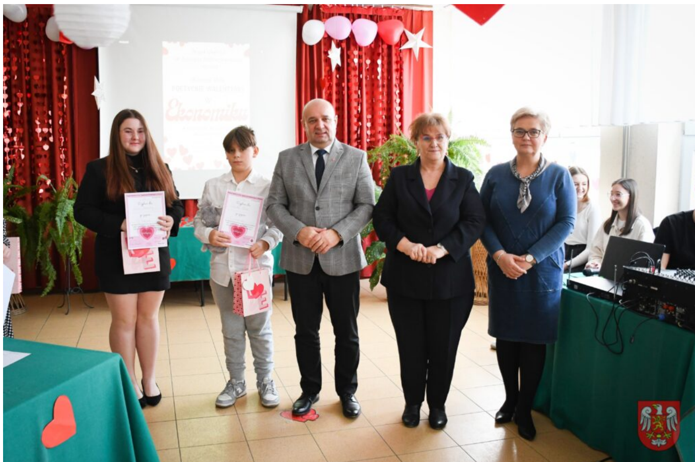
Bez tytułu (A4 (orientacja pozioma)) – 25