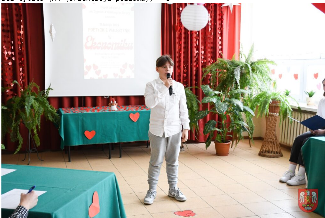
Bez tytułu (A4 (orientacja pozioma)) – 6