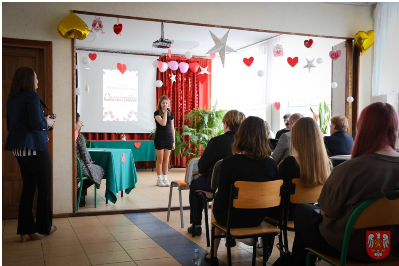
Bez tytułu (A4 (orientacja pozioma)) – 7