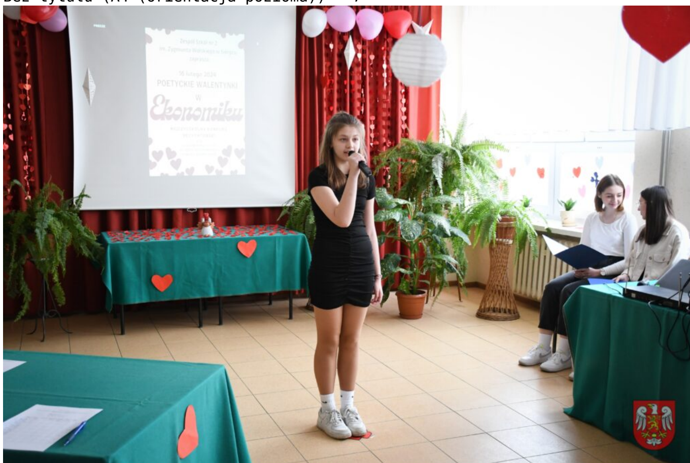
Bez tytułu (A4 (orientacja pozioma)) – 8