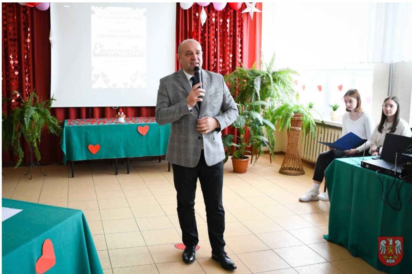
Bez tytułu (A4 (orientacja pozioma)) – 21