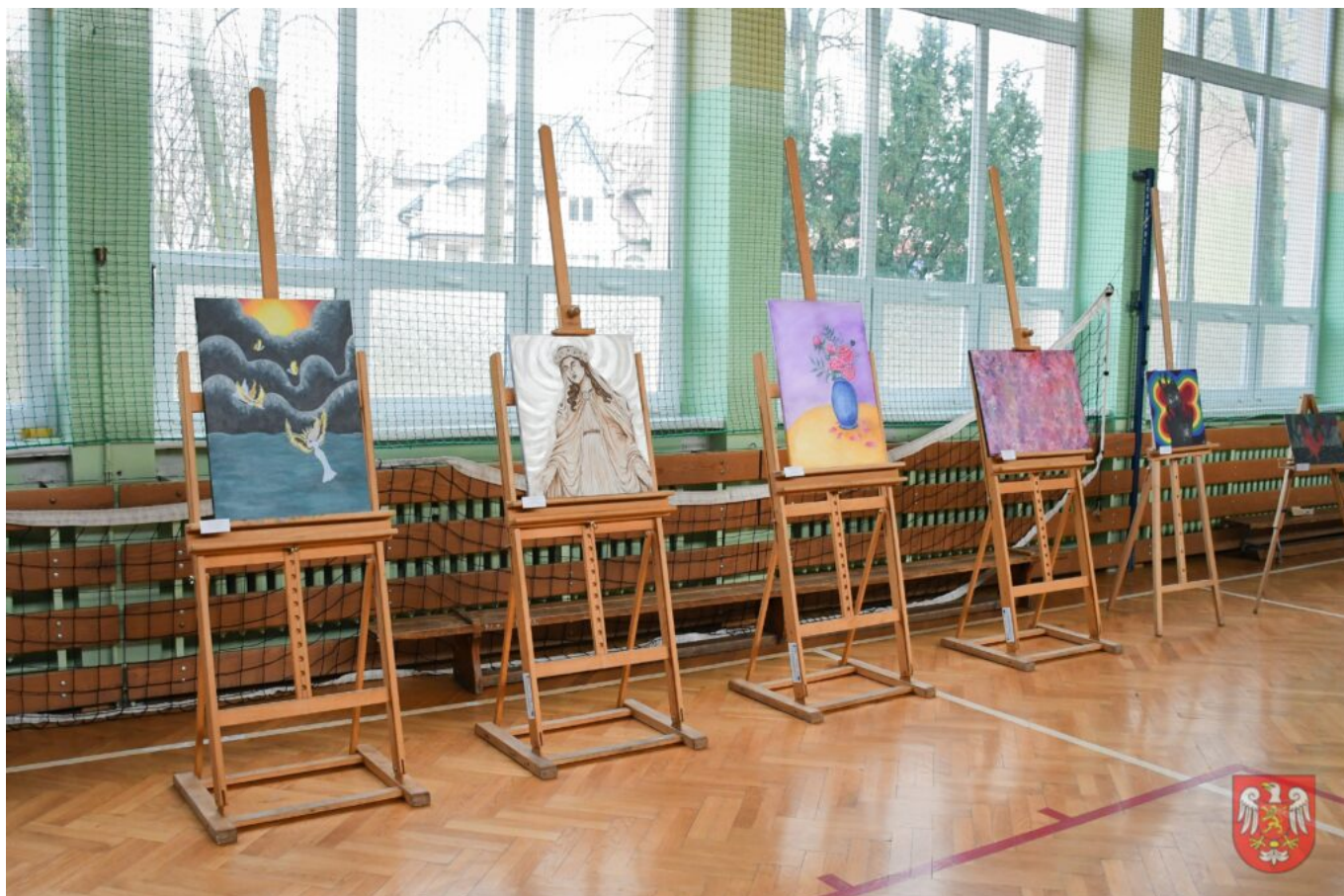
Bez tytułu (A4 (orientacja pozioma)) – 4