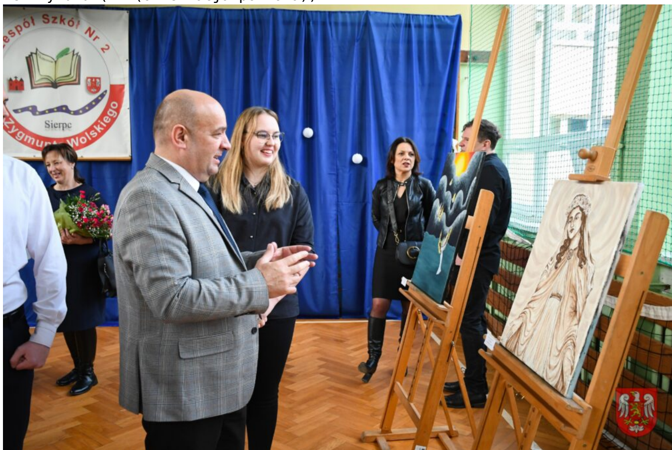
Bez tytułu (A4 (orientacja pozioma)) – 17