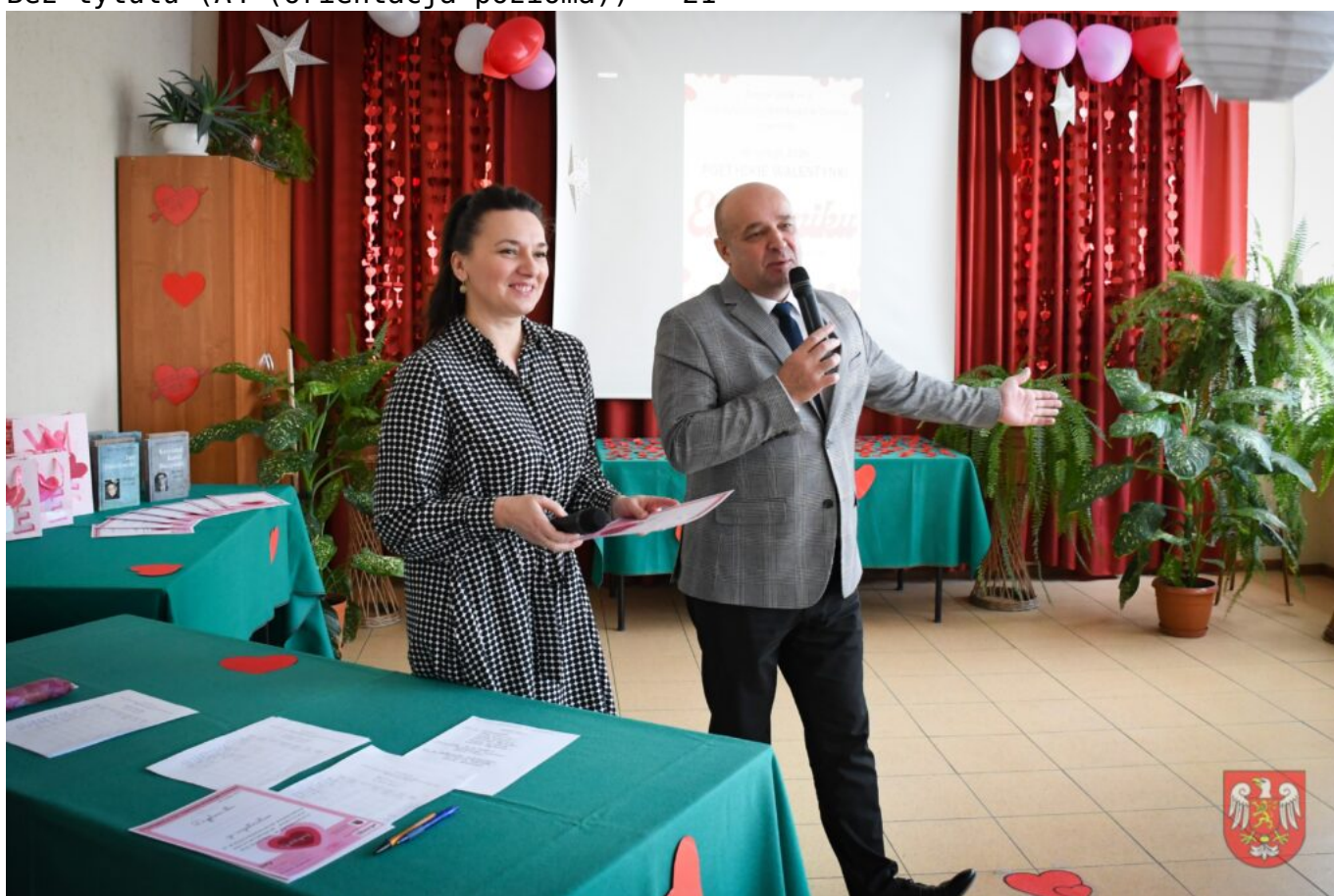
Bez tytułu (A4 (orientacja pozioma)) – 22