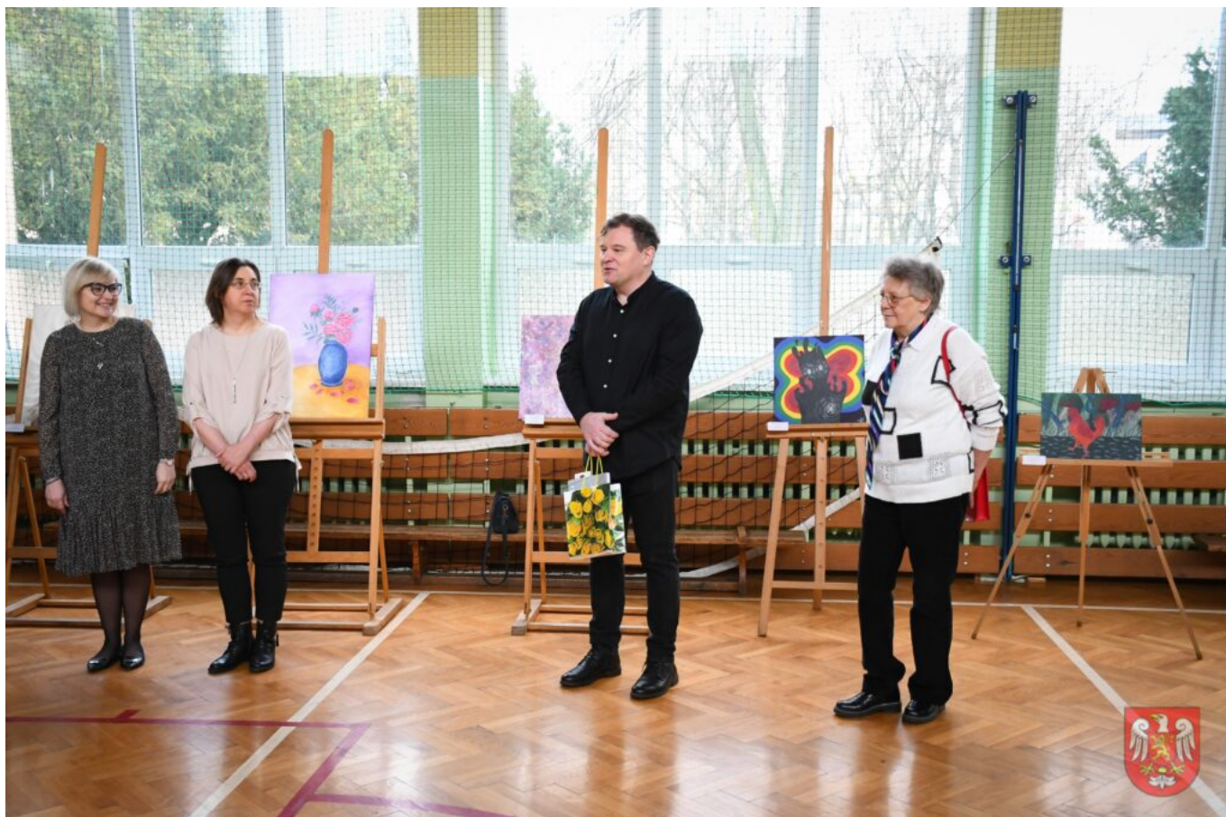
Bez tytułu (A4 (orientacja pozioma)) – 14