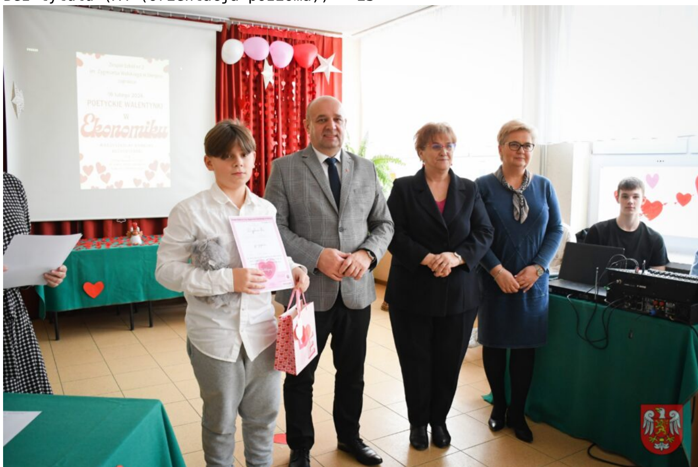
Bez tytułu (A4 (orientacja pozioma)) – 24