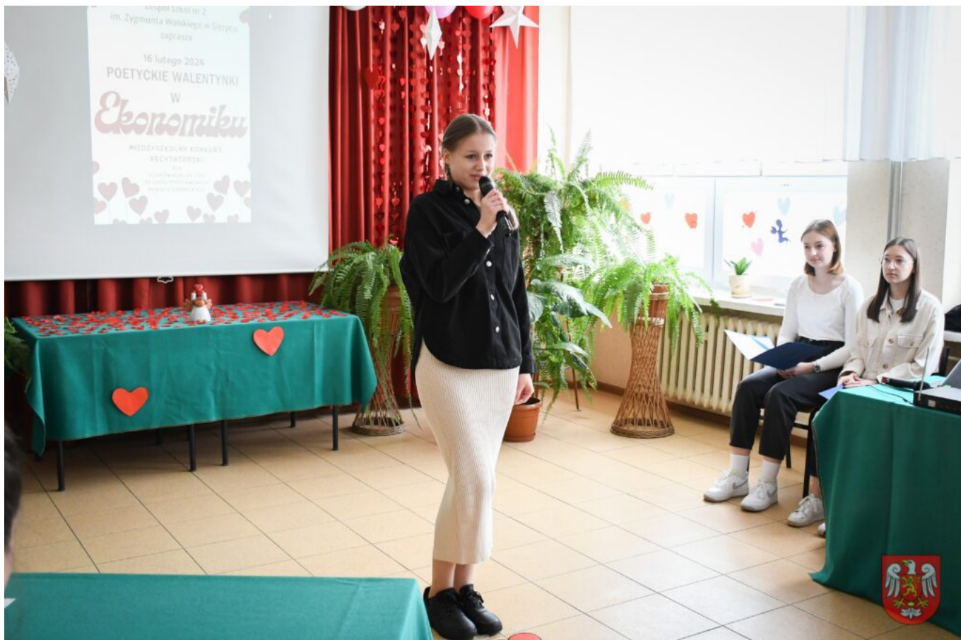
Bez tytułu (A4 (orientacja pozioma)) – 5