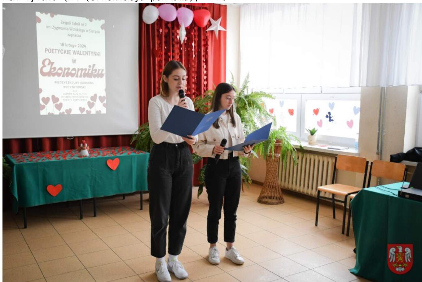
Bez tytułu (A4 (orientacja pozioma)) – 4