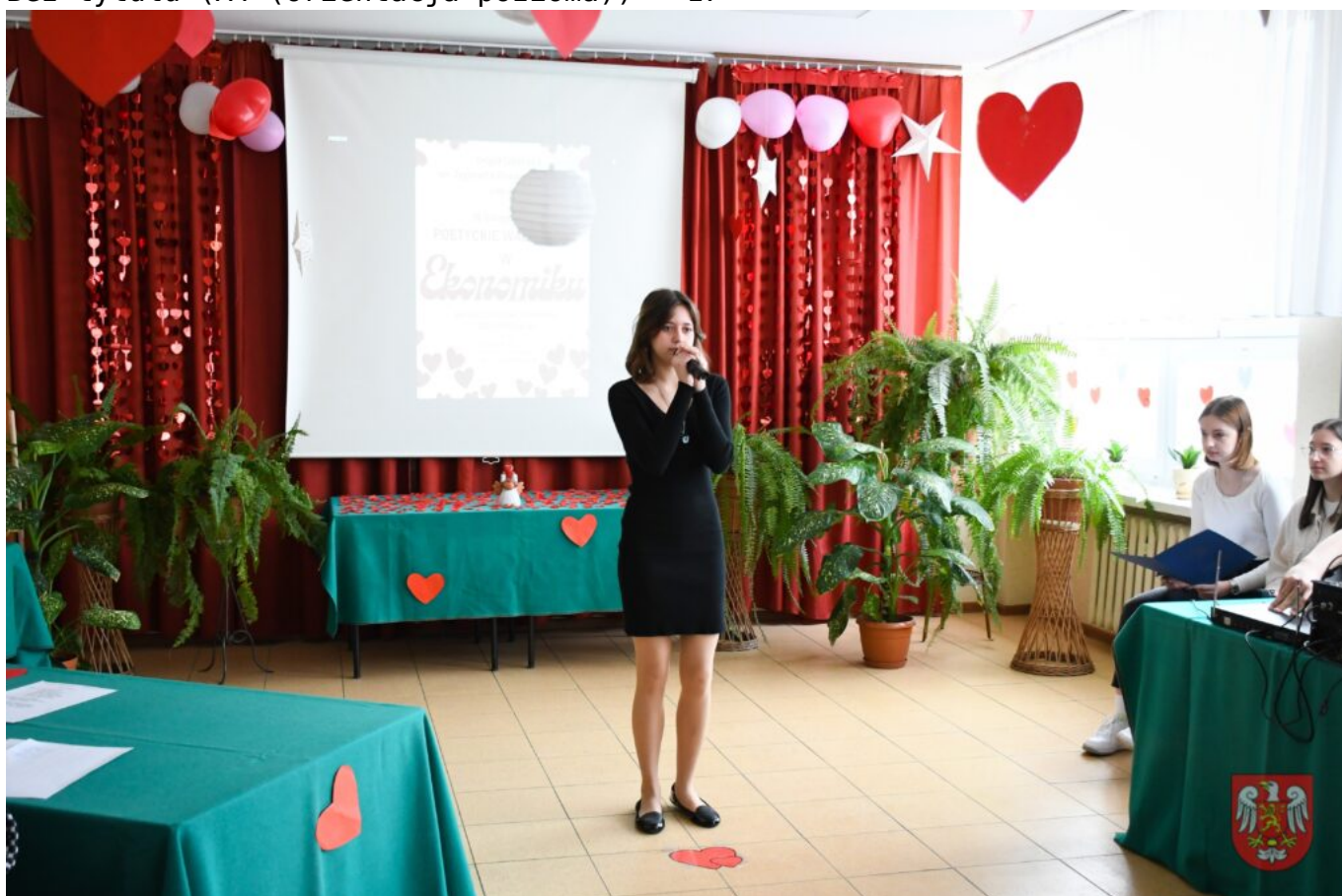
Bez tytułu (A4 (orientacja pozioma)) – 18