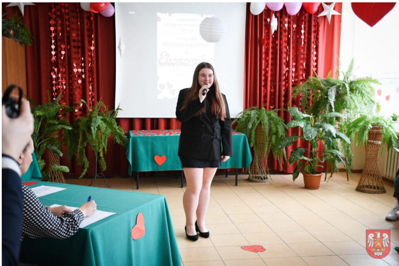
Bez tytułu (A4 (orientacja pozioma)) – 17