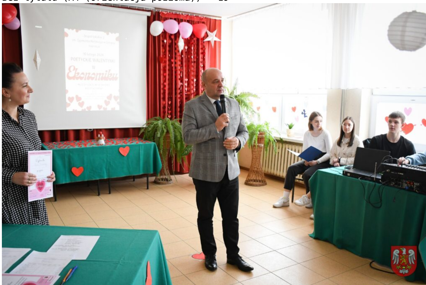
Bez tytułu (A4 (orientacja pozioma)) – 20