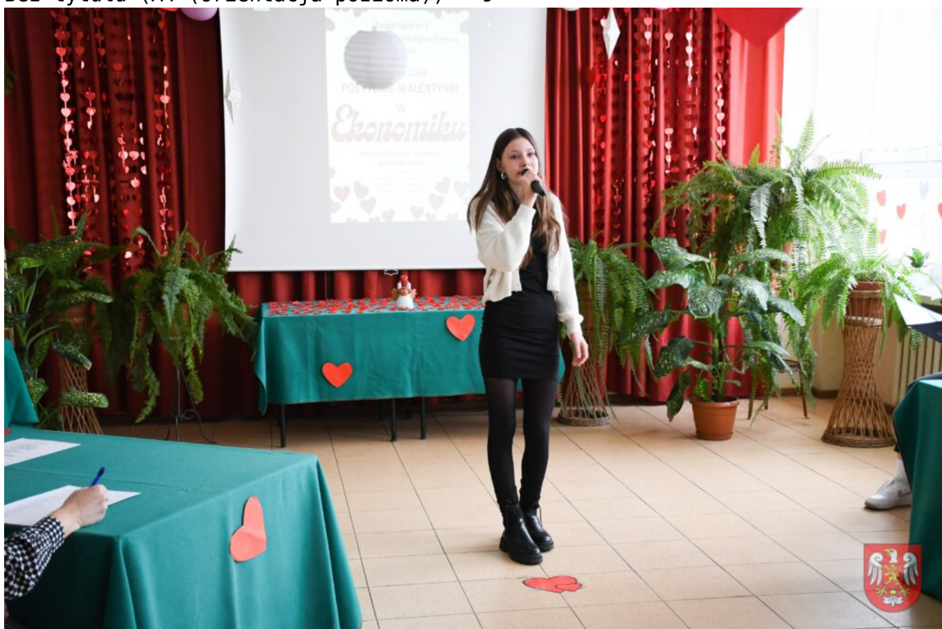
Bez tytułu (A4 (orientacja pozioma)) – 10