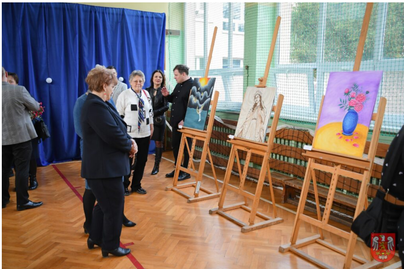
Bez tytułu (A4 (orientacja pozioma)) – 16