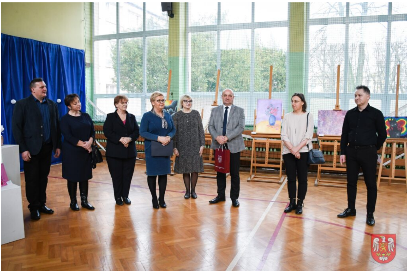
Bez tytułu (A4 (orientacja pozioma)) – 6