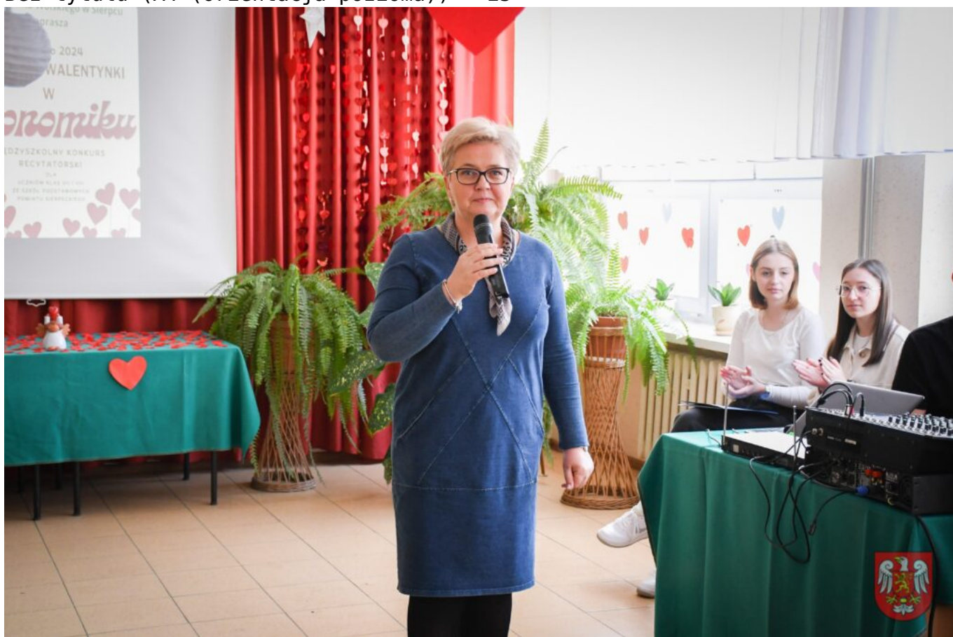
Bez tytułu (A4 (orientacja pozioma)) – 27