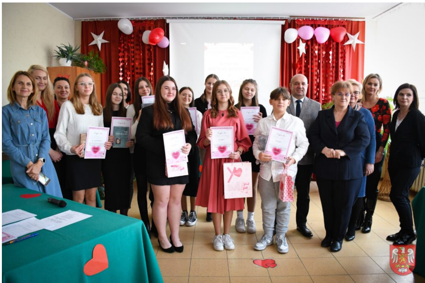
Bez tytułu (A4 (orientacja pozioma)) – 26