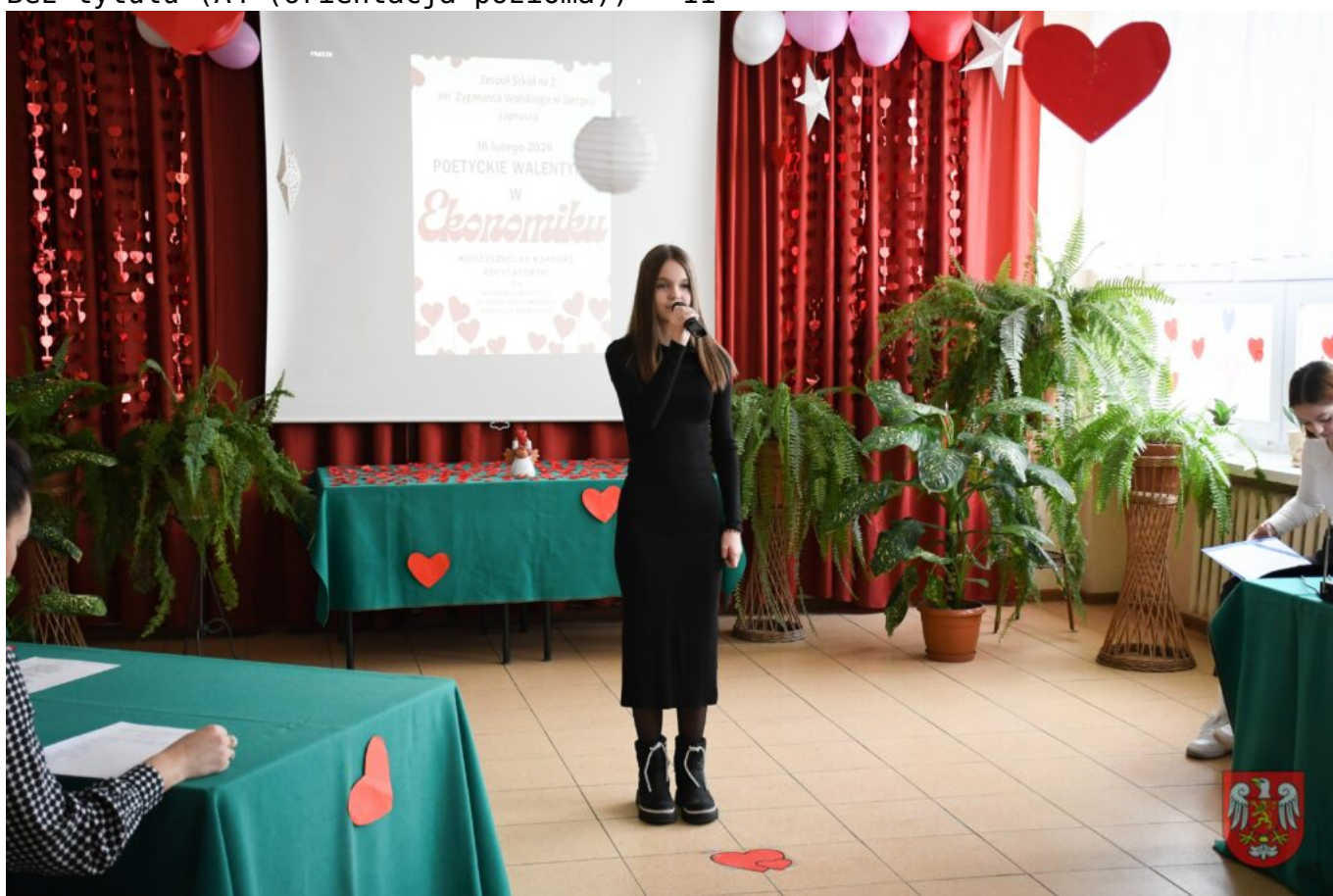
Bez tytułu (A4 (orientacja pozioma)) – 12