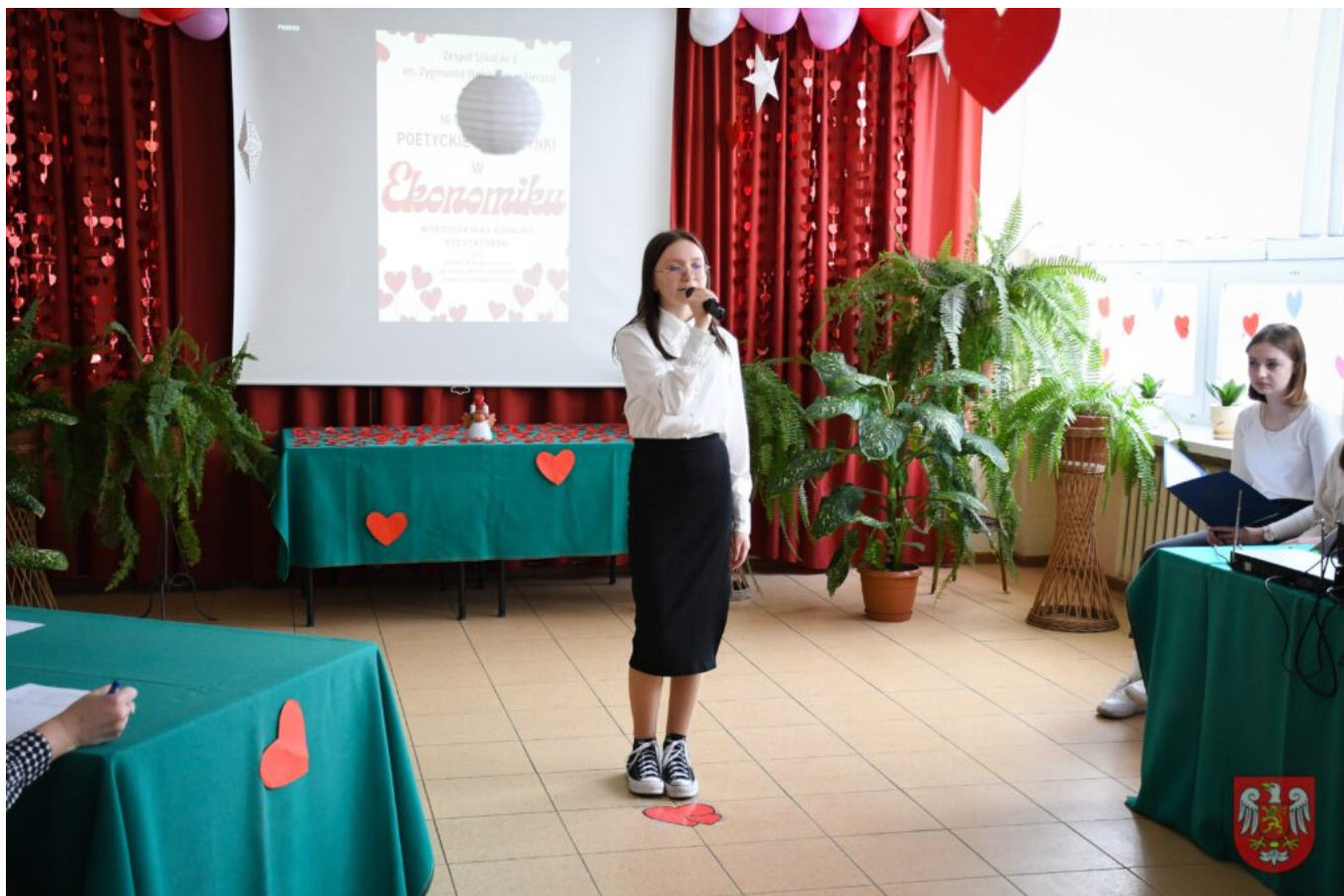
Bez tytułu (A4 (orientacja pozioma)) – 11