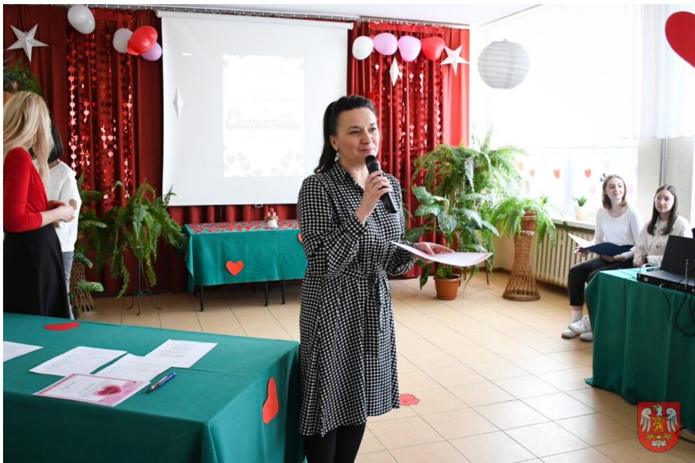
Bez tytułu (A4 (orientacja pozioma)) – 23