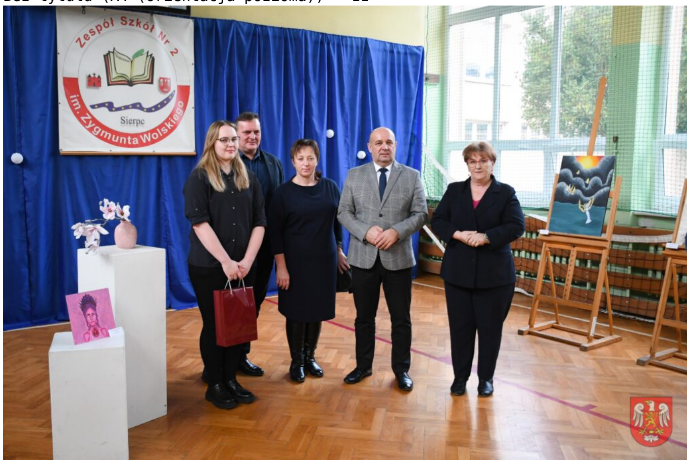
Bez tytułu (A4 (orientacja pozioma)) – 13