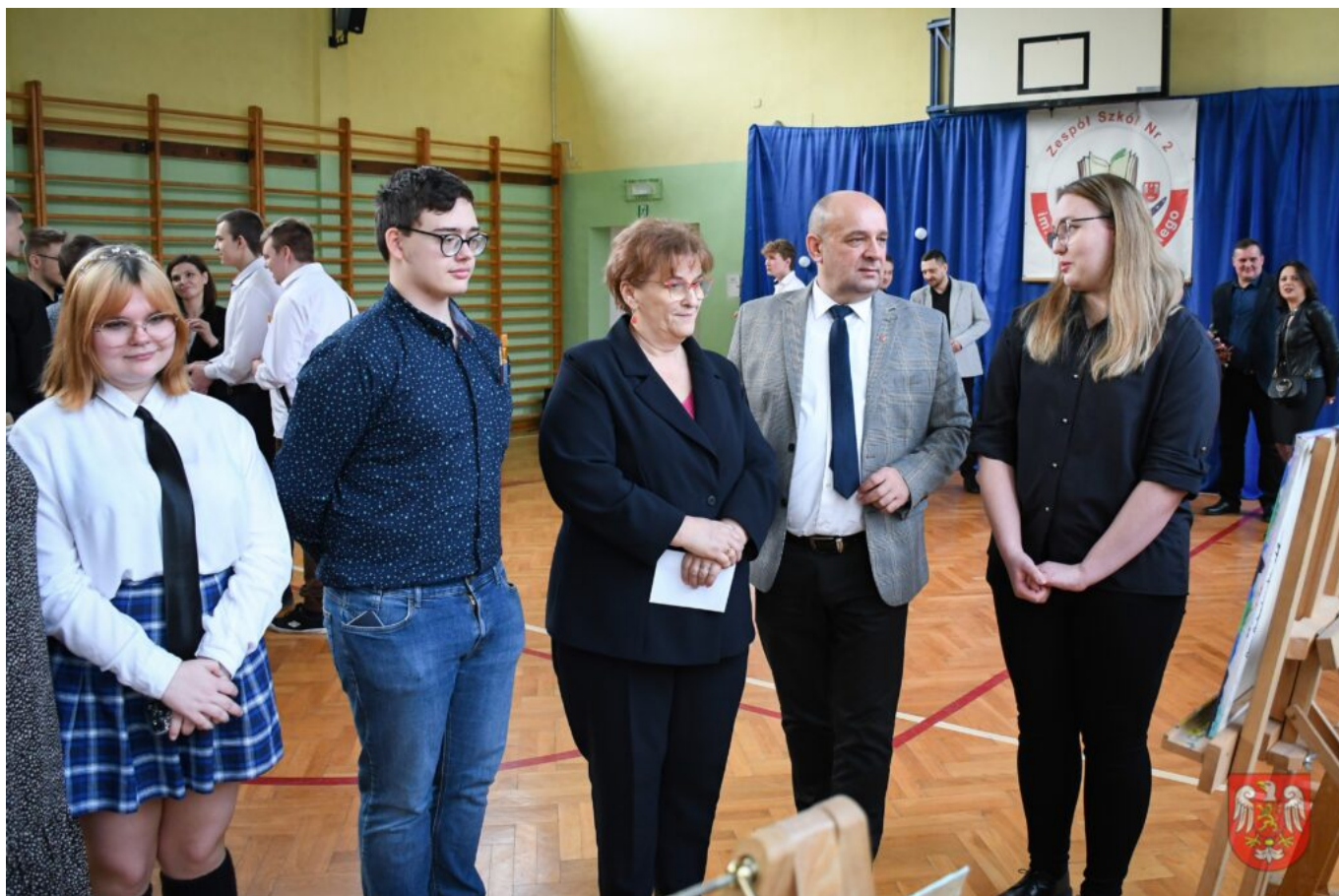
Bez tytułu (A4 (orientacja pozioma)) – 19