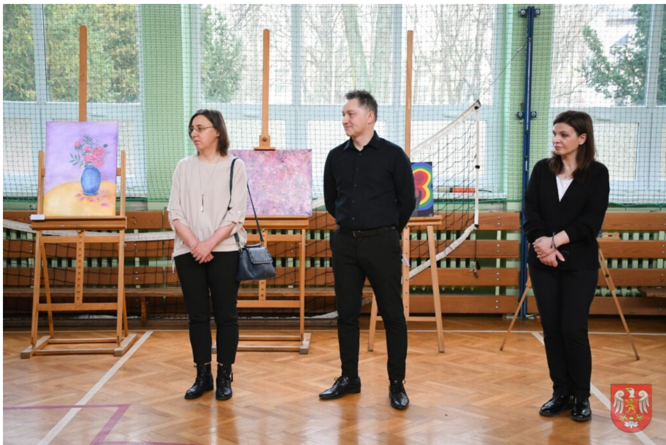
Bez tytułu (A4 (orientacja pozioma)) – 11