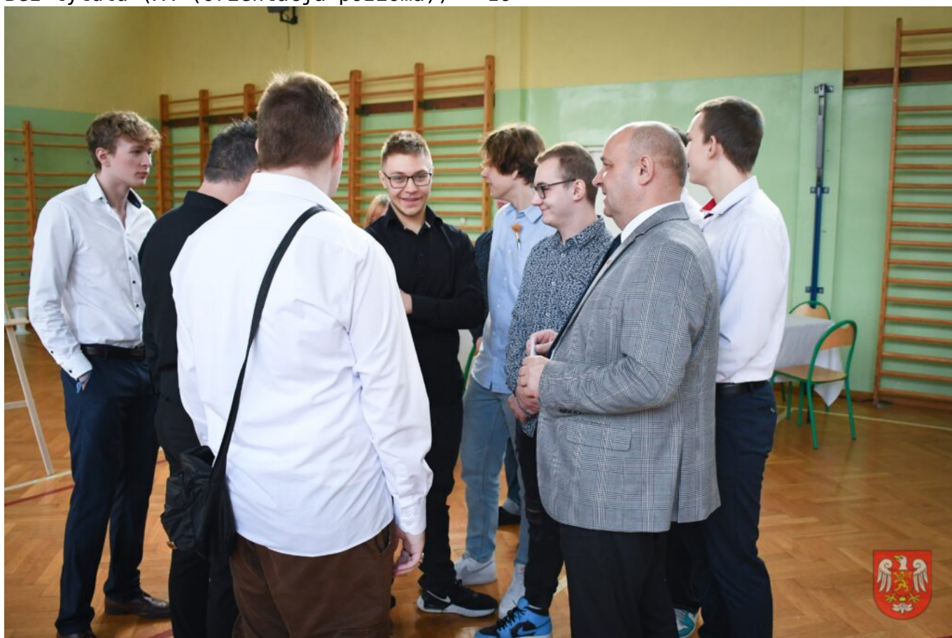
Bez tytułu (A4 (orientacja pozioma)) – 18