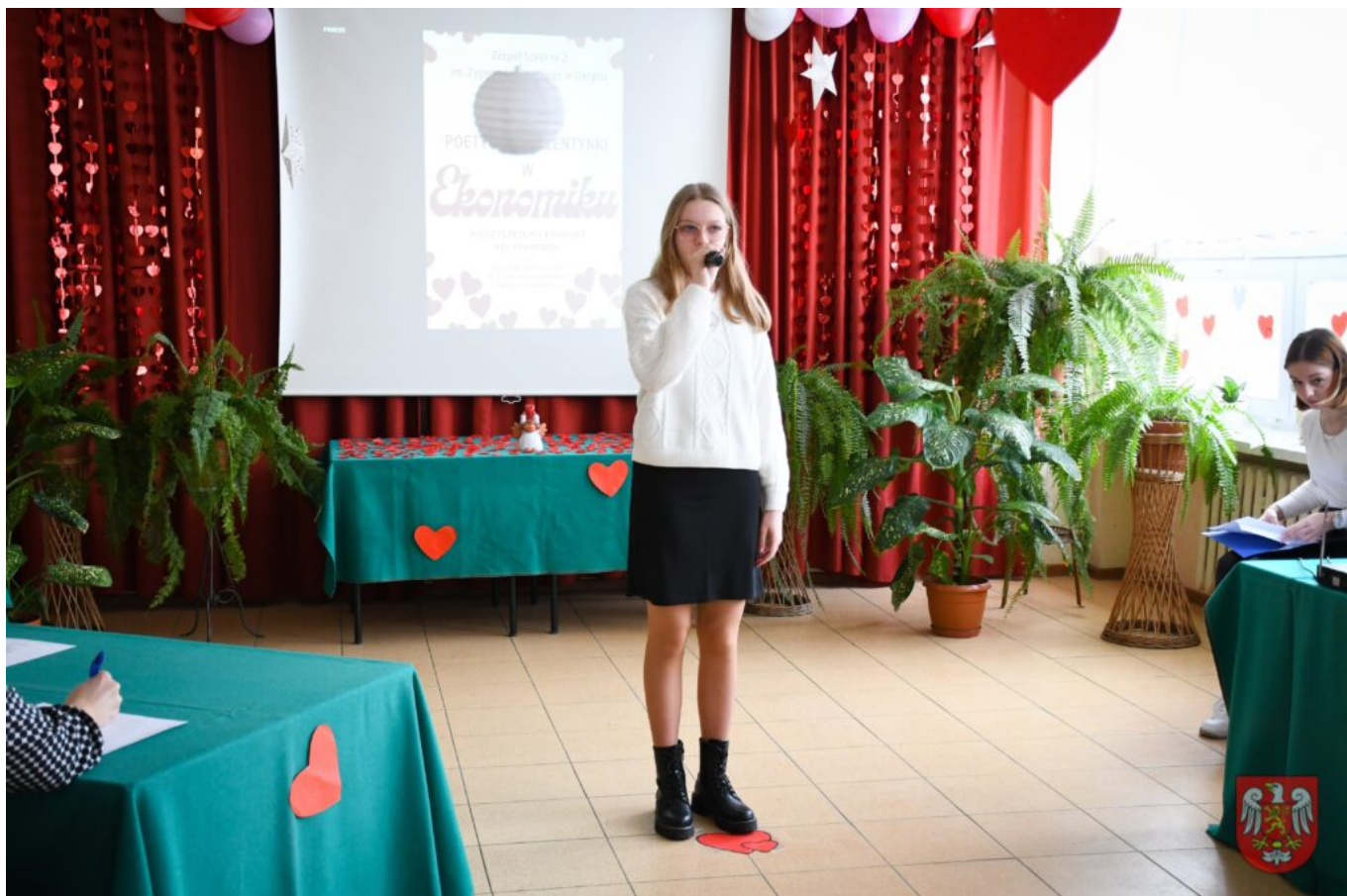
Bez tytułu (A4 (orientacja pozioma)) – 13