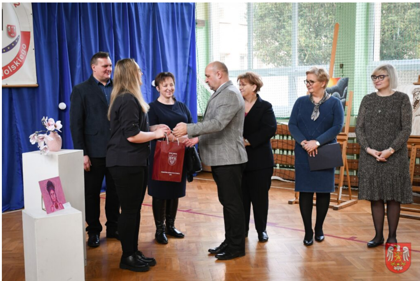
Bez tytułu (A4 (orientacja pozioma)) – 12