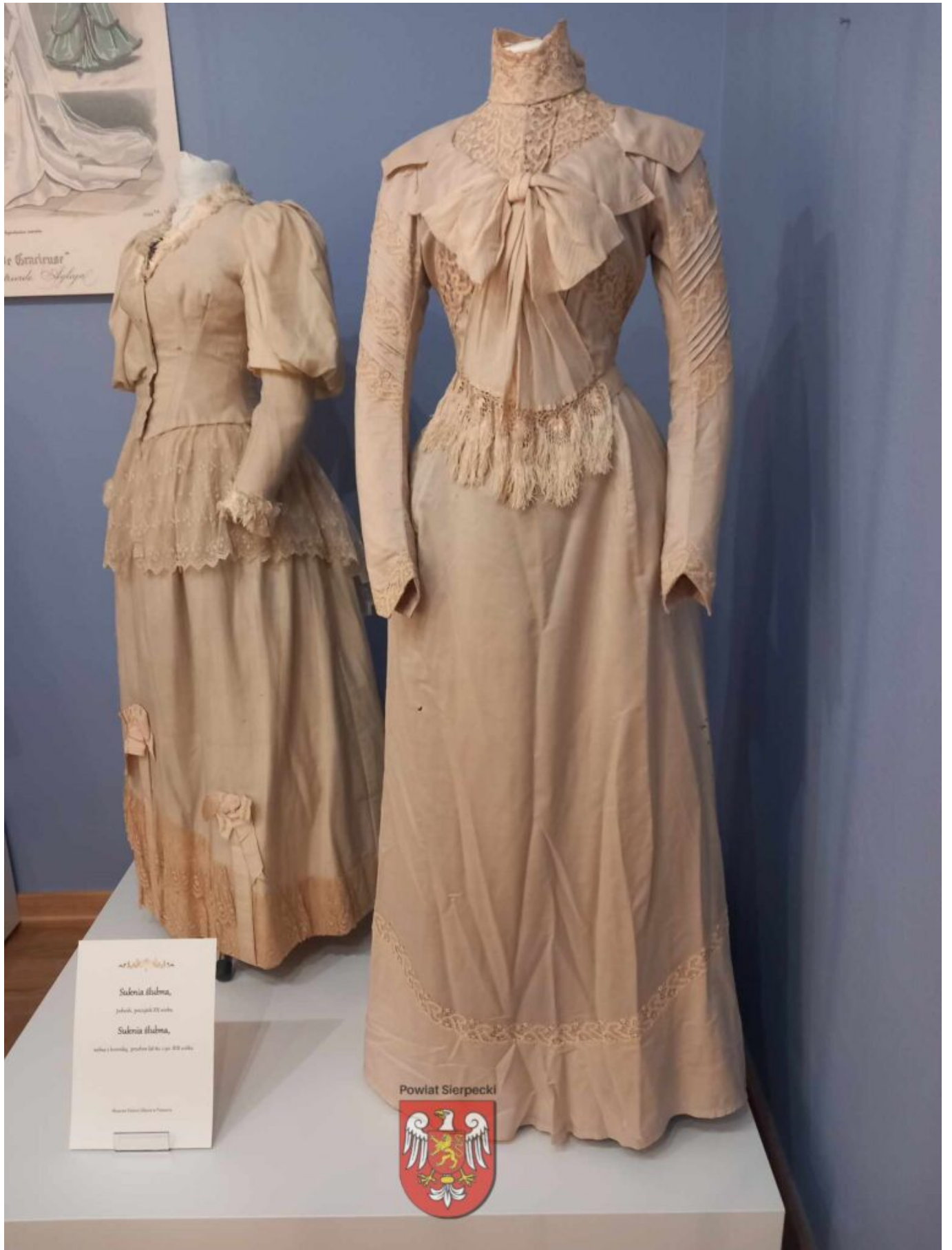
szkice i rysunki Suknia białna, jedwab, początek XX wieku Suknia białna, wełna i koronka, przełom lat 40-50 XIX wieku Museum Historyczne w Poznaniu