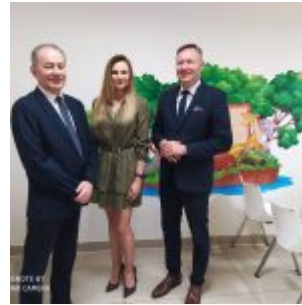
Nowa przychodnia działająca w strukturach SPZZOZ w Sierpcu