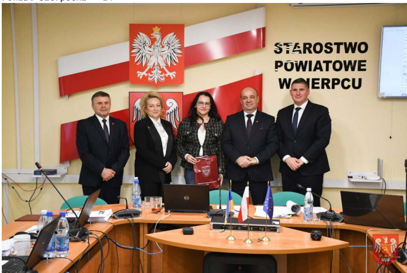
Powiat Sierpecki – 15