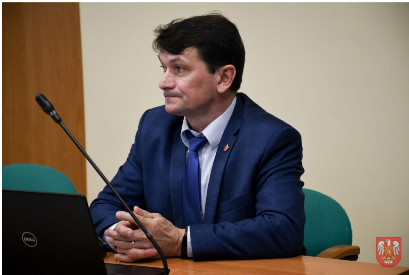
Powiat Sierpecki – DSC_9503