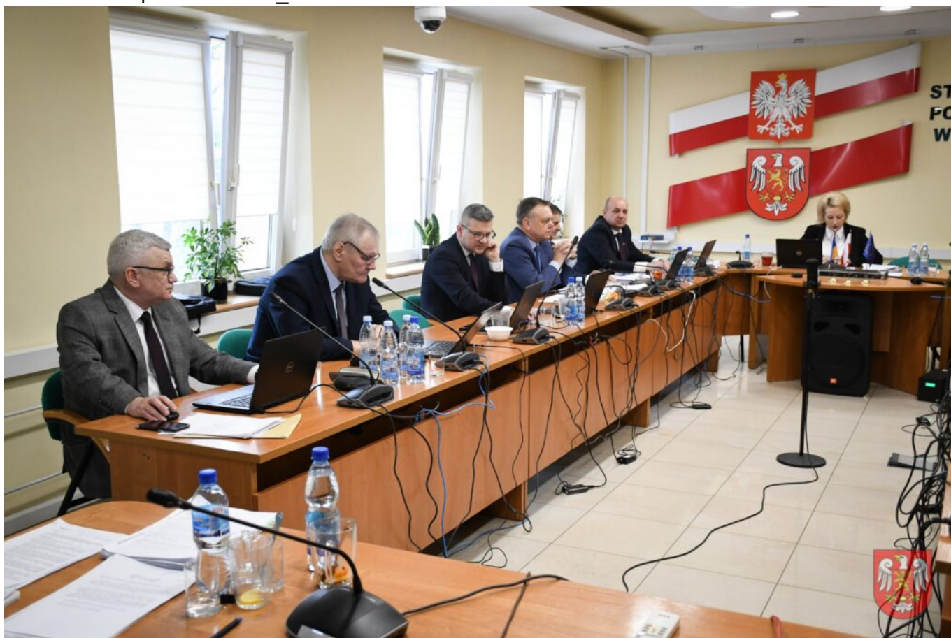
Powiat Sierpecki – DSC_9506