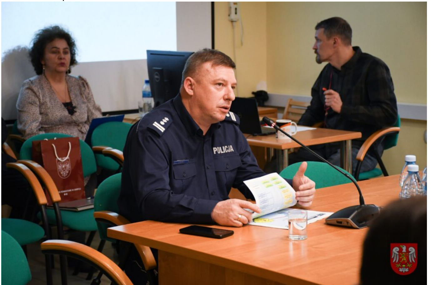
Powiat Sierpecki – 5