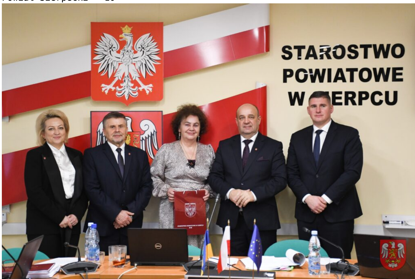
Powiat Sierpecki – 11