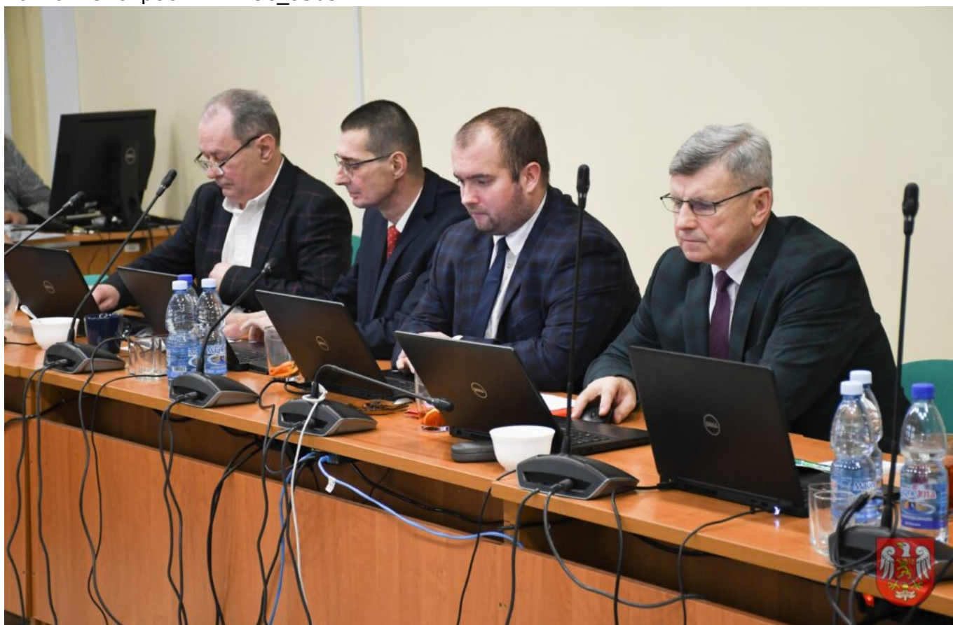
Powiat Sierpecki – DSC_9505