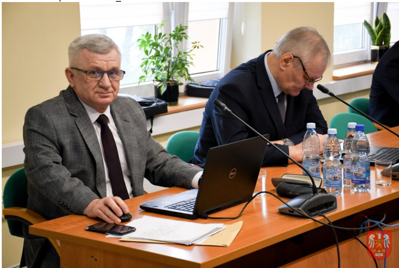
Powiat Sierpecki – DSC_9500