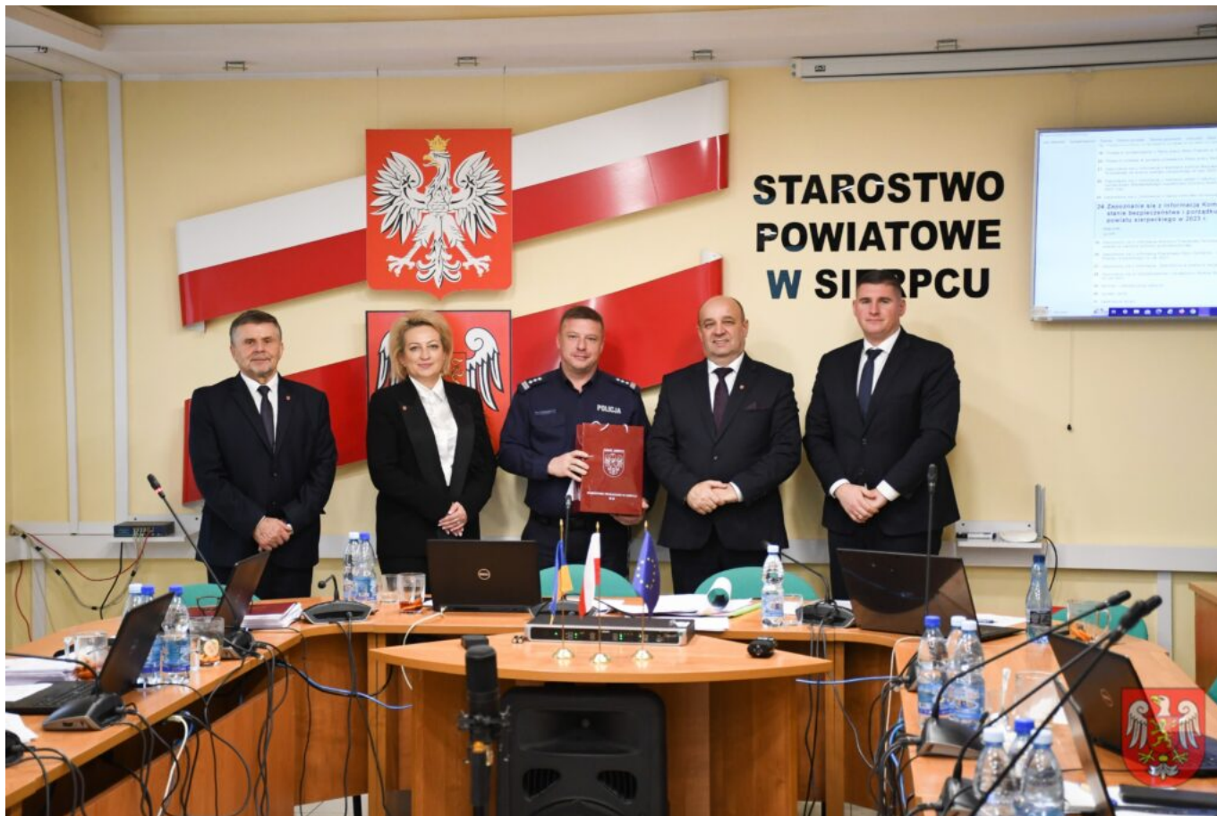
Powiat Sierpecki – 6