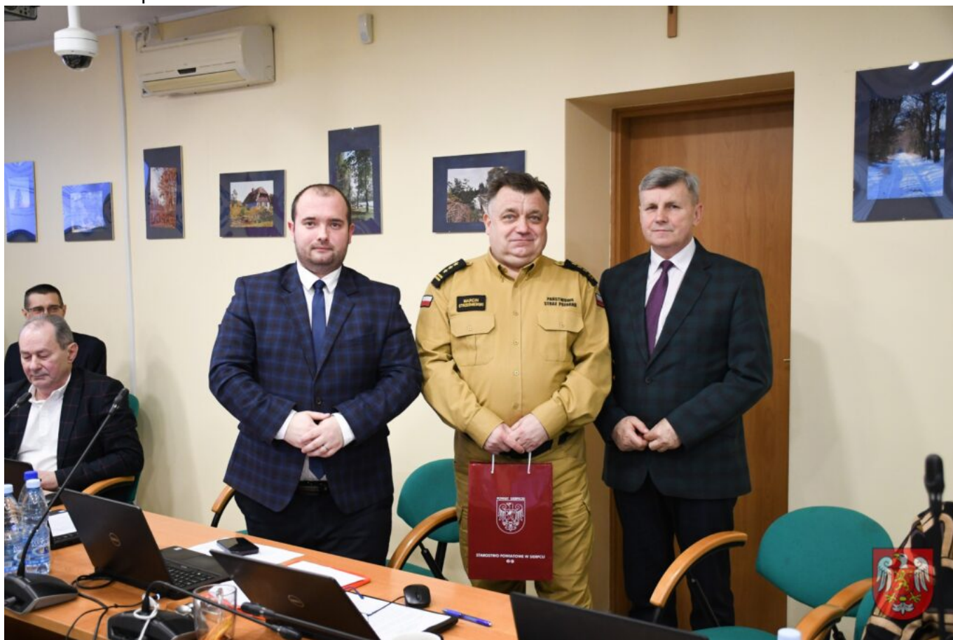
Powiat Sierpecki – 9