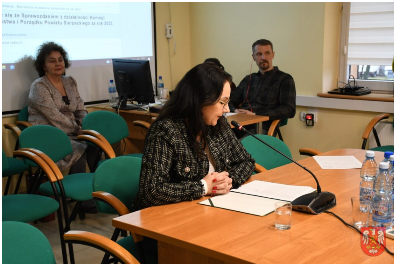
Powiat Sierpecki – 14