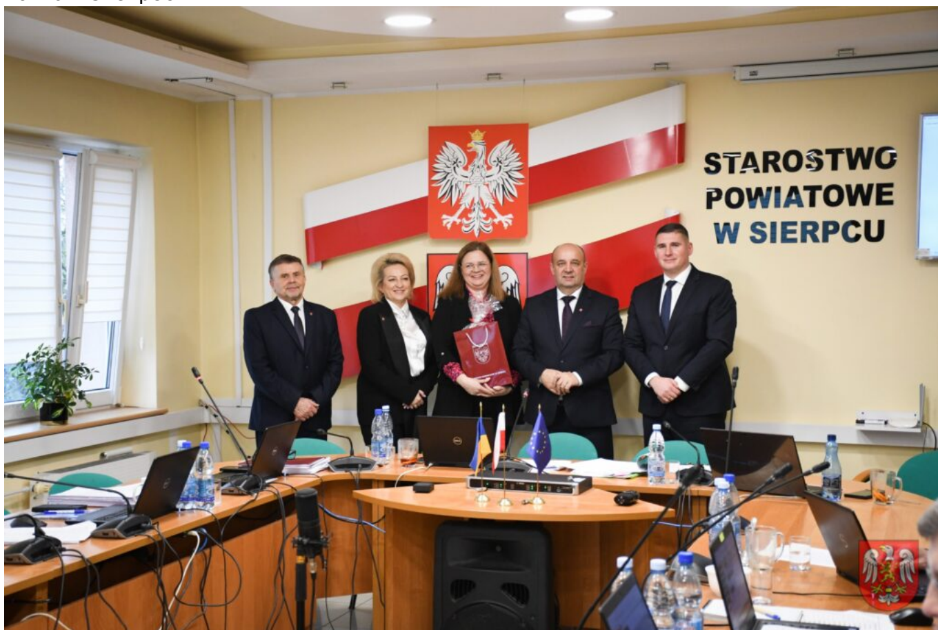
Powiat Sierpecki – 13