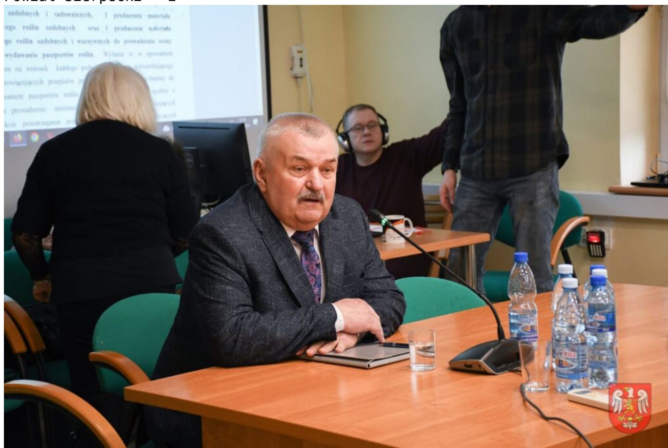
Powiat Sierpecki – 3