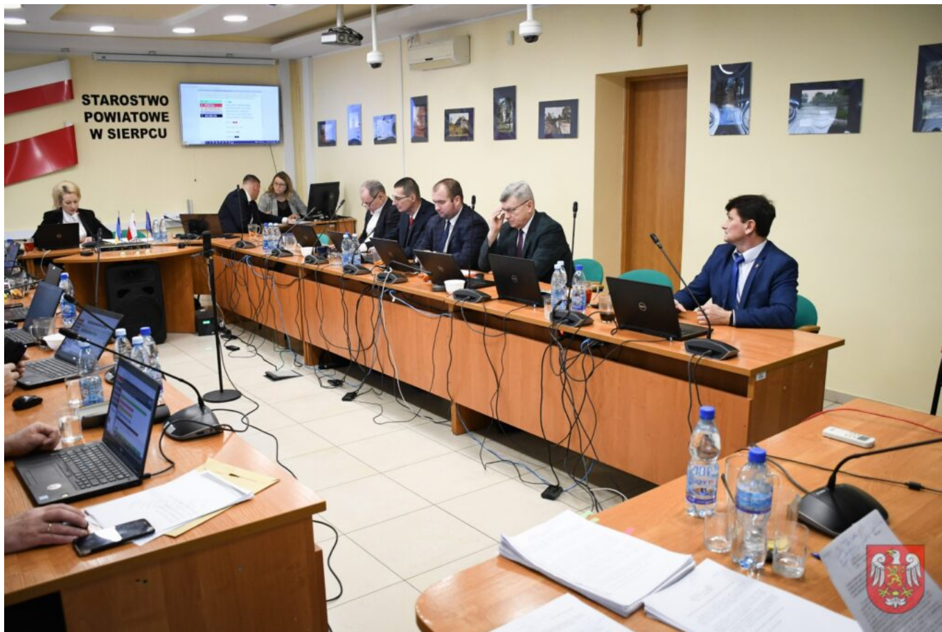
Powiat Sierpecki – DSC_9507