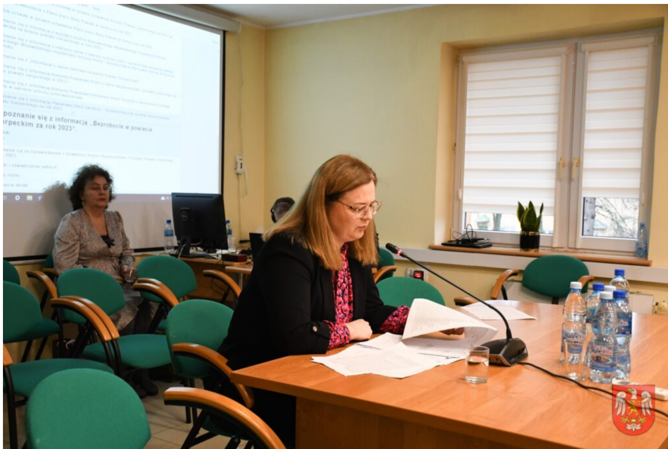
Powiat Sierpecki – 12