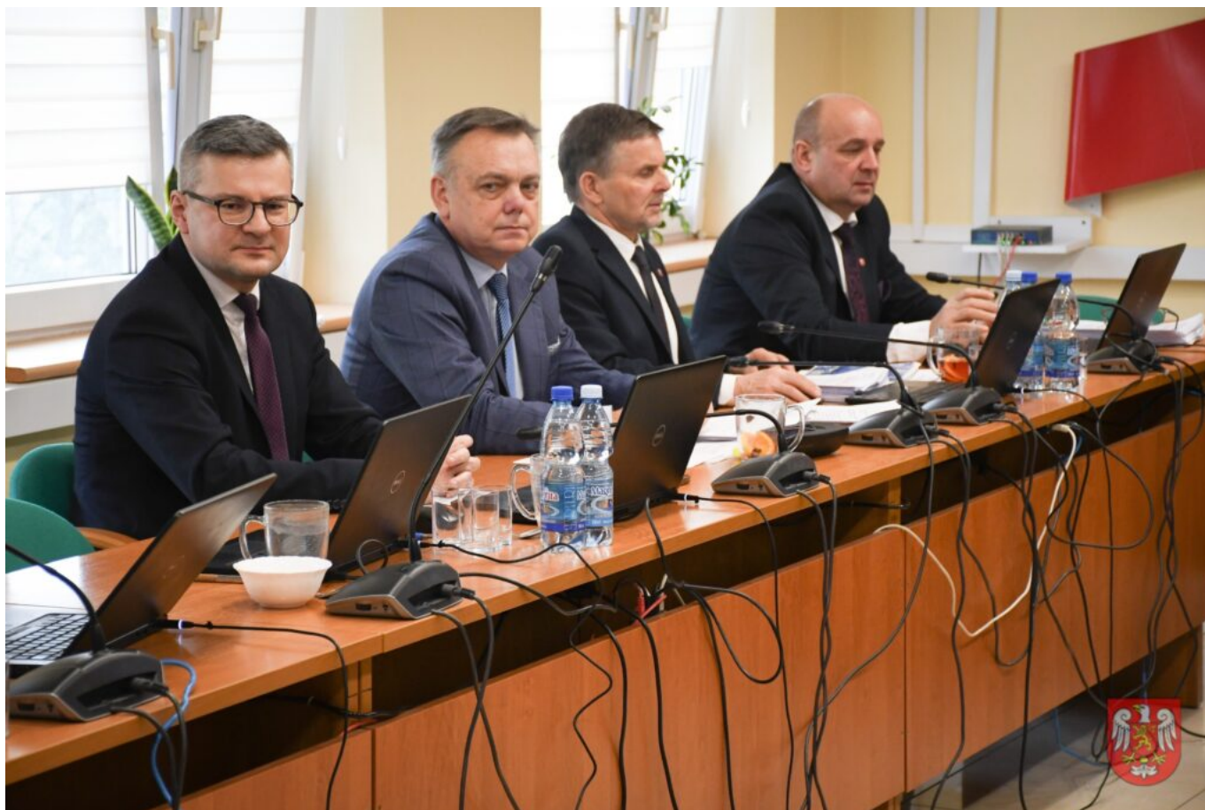
Powiat Sierpecki – DSC_9504