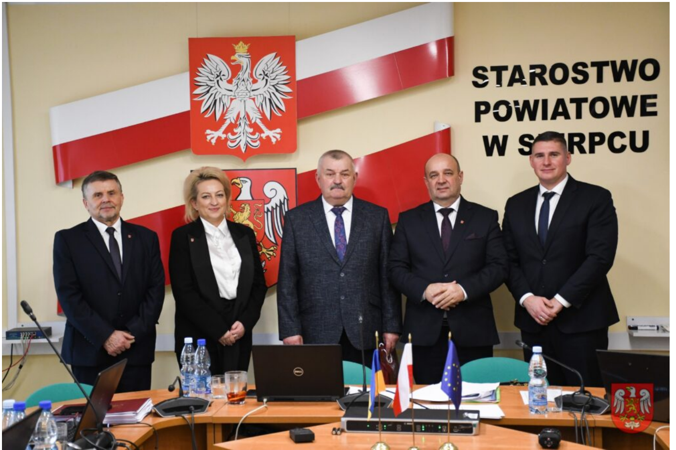
Powiat Sierpecki – 4