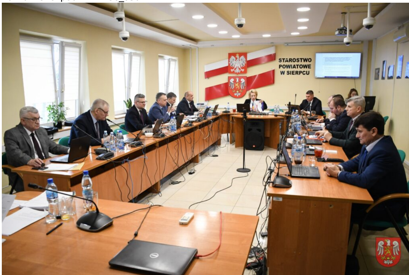
Powiat Sierpecki – DSC_9509