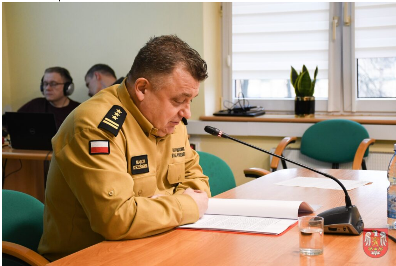
Powiat Sierpecki – 7