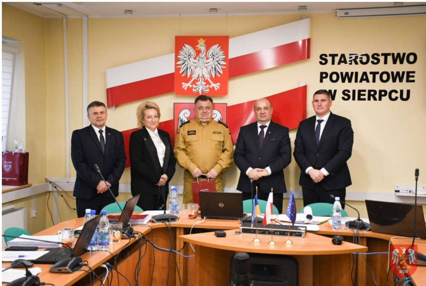
Powiat Sierpecki – 8