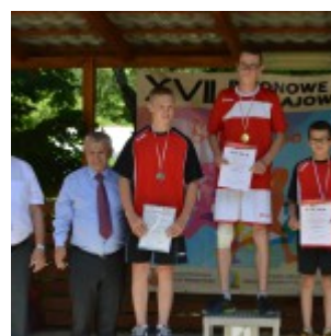
XVII Rejonowe Biegi