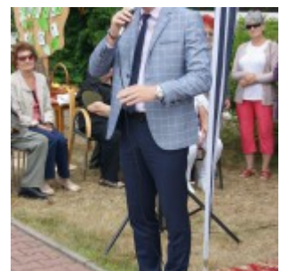
VII Zjazd Rodzin i Przyjaciół Domu w Domu Pomocy Społecznej w Szczutowie