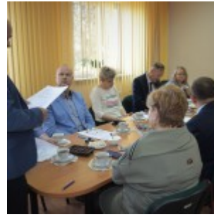
Posiedzenie Powiatowej Rady Rynku Pracy w Sierpcu