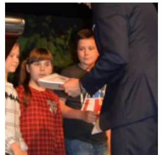
Podsumowanie Powiatowego konkursu plastycznego „Polska moja Ojczyzna”