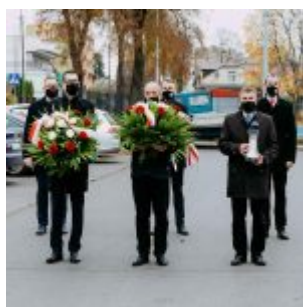
Narodowe Święto Niepodległości