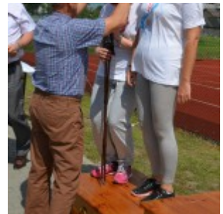
Gmina Mochowo na sportowo