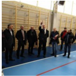
Odbiór techniczny hali sportowej przy ZS nr 1 w Sierpcu