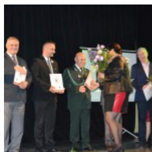
20-lecie Stowarzyszenia Chorych na Stwardnienie Rozsiane w Sierpcu